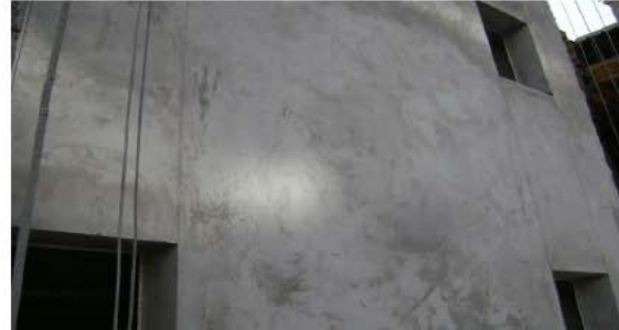
Acabamento desempenado Utilizado como base para textura