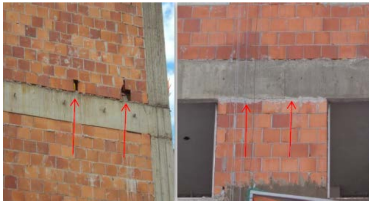
Preparação da base Fechamento de buracos na alvenaria. Encunhamento externo com argamassa Cimento Guaíba apropriada respeitando a espessura de 20 a 30 mm