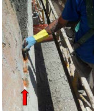
Preparação da base Remoção de pontas de ferro e tratamento com tinta anti-corrosiva