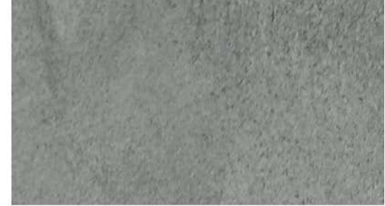
Acabamento feltrado Utilizado para pintura