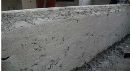
Acabamento reguado Utilizado para assentamento de pastilhas e plaquetas