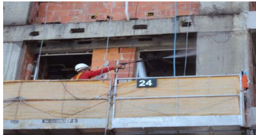
Preparação da base Lavagem das superfícies com lava-jato